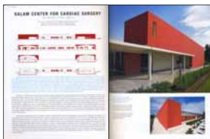
Green architecture now! , Jodidio Philip, Taschen Editors, 2009.