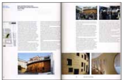
SE/AS3 Edilizia sostenibile II Ed. 68 Progetti bioclimatici. Analisi e parametri energetici Sistemi Editoriali, 2008 “Nuova sede amministrativa di Banca Popolare Etica, Padova”, pp. 162-163.