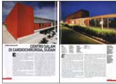
L'ARCA n. 240 (ottobre 2008) "Centro Salam di Cardiocirurgia, Sudan", pp. 62-69.