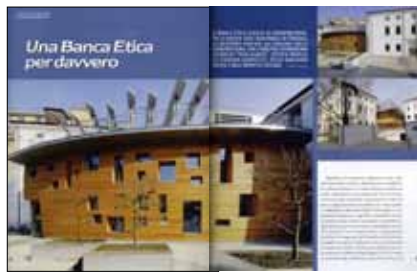
CASA E CLIMA , Anno II n. 7, Aprile 2007: “Una banca etica per davvero” di Aldo Romagna, pp. 40-45.