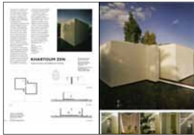
THE ARCHITECTURAL REVIEW , Volume CCXXII n. 1330, UK Dicembre 2007: "Khartoum zen, a place of prayer and meditaion for all faiths", pp. 48-49.