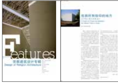
id+c. Interior design and construction , P.R. China, novembre 2008: "Design of Religion Architecture" di Samuele Martelli, pp.88-91;