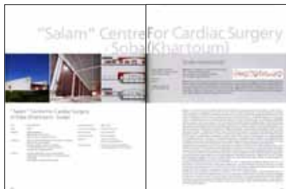
ItaliArchitettura - Vol. II A cura di: Prestinzenza Puglisi Luigi; Editore: Utet Scienze Tecniche, 2009.