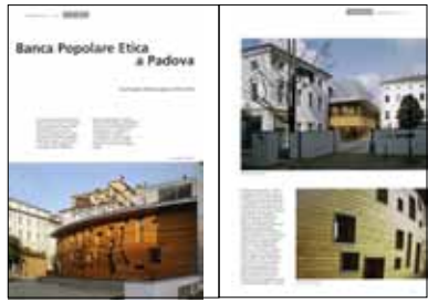
Paesaggio urbano , Anno XVI n. 5, Settembre-Ottobre 2007: “Banca Popolare Etica a Padova”, pp. 52-55.