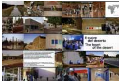
DOMUS , n. 912, Marzo 2008: "Il cuore del deserto" di Francesca Picchi, pp. 20-27.