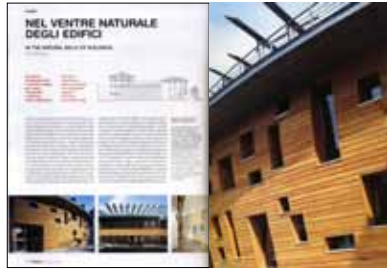
OTTAGONO , Anno XLIII n. 209, Aprile 2008: “Nel ventre naturale degli edifici” di Elisa Montalti, pp. 218-219.