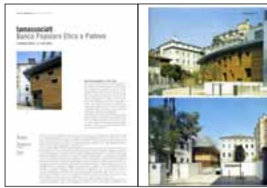
L'ARCHITETTURA NATURALE , Anno X n. 35, Giugno 2007: “Banca Popolare Etica a Padova” di Ferdinando Gottard, pp. 22-29.