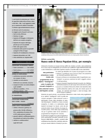
Architettura sostenibile. Una scelta responsabile per uno sviluppo equilibrato , a cura di Gianluca Minguzzi, Skira Editore, Novembre 2008; “Nuova sede di Banca Popolare Etica, Padova” di Tamassociati, pp. 152-157.